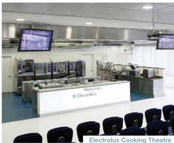
Electrolux Cooking Theatre