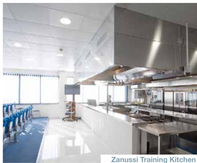
Zanussi Training Kitchen