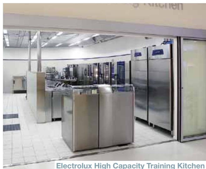
Electrolux High Capacity Training Kitchen