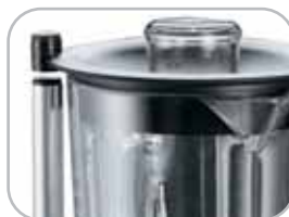
Micro su coperchio Microswitch on cover