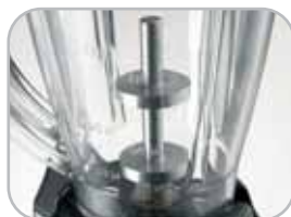
Modello caffè Coffee model