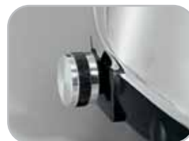
Modello VV: variatore di velocità Speed control optional